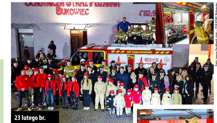
23 lutego br.

Nowy wóz wyposażony jest m.in. w radiotelefon, pneumatycznie wysuwany (na wysokość do 4,5 m) maszt oświetleniowy z obrotową lampą LED