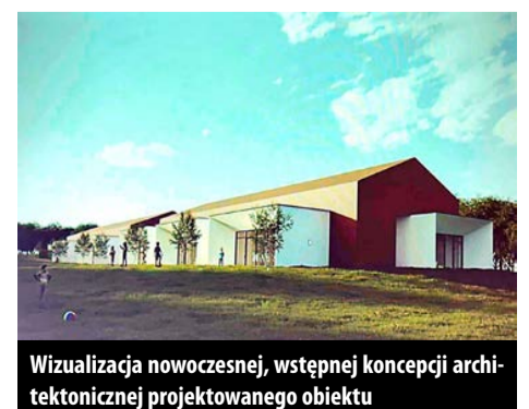
Wizualizacja nowoczesnej, wstępnej koncepcji architektonicznej projektowanego obiektu