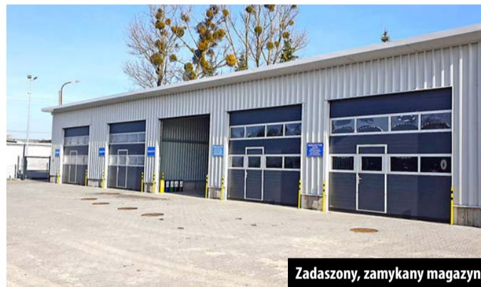
Zadaszony, zamykany magazyn