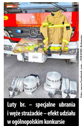
Luty br. – specjalne ubrania i węże strażackie – efekt udziału w ogólnopolskim konkursie

W 2023 r. druhowie z Bukowca wzięli udział w 26 akcjach ratowniczo-gaśniczych – 19 lokalnych zagrożeniach i 7 pożarach. Jednostka OSP Bukowiec należy do Krajowego Systemu Ratowniczo-Gaśniczego.