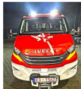
23 lutego br. IVECO dla OSP Bukowiec kosztował 460 tys. zł – gmina przeznaczyła na jego zakup 260 tys. zł

23 lutego br. druhowie z OSP Bukowiec oraz przedstawiciele strażackich władz, władz gminy Brójce, powiatu łódzkiego wschodniego oraz mieszkańcy, powitali lekki samochód ratowniczo-gaśniczy.