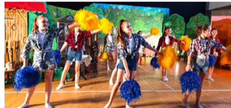
Młodość, energia, rytm, kolor...

Premiera tego przedstawienia odbyła się 11 grudnia 2023 r. (tradycyjny, mikołajkowy prezent od rodziców i nauczycieli z Bukowca dla dzieci z gminy Brójce).