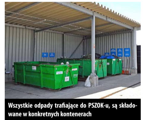
Wszystkie odpady trafiające do PSZOK-u, są składowane w konkretnych kontenerach

Prace przy budowie ujęcia wody i wodociągu Kotliny – Kurowice, z którego korzystać mają też mieszkańcy Karpina. 29 lutego br. pracownicy firmy EKONZBUD, realizującej tę wartość blisko 5 mln zł inwestycję, wykonali przewiert pod tamtejszą drogą, a że w pobliżu biegnie ropociąg, roboty nadzorowali przedstawiciele spółki PERN, zajmującej się bezpieczeństwem logistyki naftowej. Cała inwestycja ma być gotowa w połowie roku. Gmina uzyskała na nią dotację w wysokości 3,8 mln zł z Programu Inwestycji Strategicznych Polski Ład.