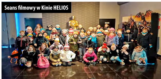
Seans filmowy w Kinie HELIOS

...zaczęły się już 17 stycznia wyjazdem do kina na seans filmu „Pan Zabawka”.