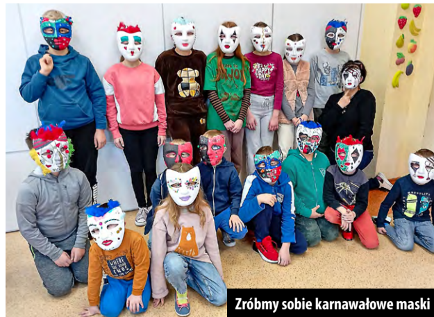
Zróbmy sobie karnawałowe maski

24 stycznia sala Gminnego Ośrodka Kultury w Brójcach zamieniła się w zakład cukierniczy. Wiedza i praktyka z warsztatów pieczenia ciasta, na pewno przydadzą się młodym ludziom.