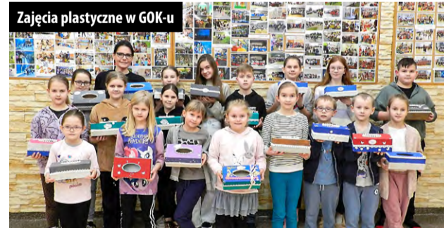
Zajęcia plastyczne w GOK-u

Jak karnawał, to karnawał! A na karnawałowej zabawie najlepiej dokazywać w... masce. 25 stycznia tak właśnie było. Dzieci same robiły sobie karnawałowe maski i świetnie się przy tym bawiły.