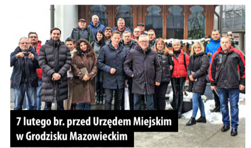
7 lutego br. przed Urzędem Miejskim w Grodzisku Mazowieckim

– Mam już spore doświadczenie w pracy samorządowej, ale powiem szczerze, nie uczestniczyłem nigdy w takim wyjeździe, żeby coś zobaczyć