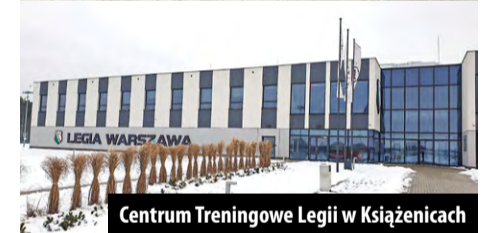
Centrum Treningowe Legii w Książenicach