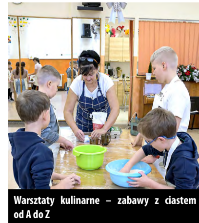
Warsztaty kulinarne – zabawy z ciastem od A do Z

Teraz czekamy na ofertę GOK-u na tegoroczne wakacje.