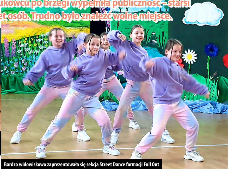
Bardzo widowiskowo zaprezentowała się sekcja Street Dance formacji Full Out