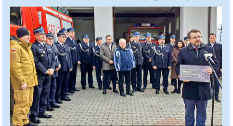
Wicemarszałek wręczył symboliczne promesy druhom z OSP Wardzyn i OSP Bukowiec oraz OSP Górki Duże i OSP Kruszów z gminy Tuszyn

27 lutego br. Piotr Adamczyk, wicemarszałek województwa łódzkiego zaprosił przedstawicieli jednostek strażackich z powiatu łódzkiego wschodniego do strażnicy OSP w Wardzynie i przekazał im promesy na zakup wozów strażackich ze wsparciem ze środków rządowych.