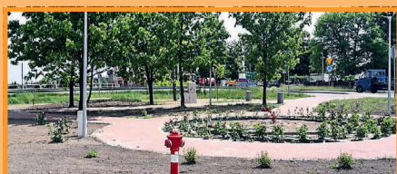
Chodzi o stworzenie przyjaznego, zielonego i funkcjonalnego miejsca w centrum Kurowic

Jest tu już dużo nowej roślinności. Drzewa, pozostawione na miejscu, przejdą zabiegi regulacji koron. Zamontowano nowy hydrant. Będą jeszcze ławki, kosze na śmieci i stojak na rowery. Przypomnijmy, że na realizację inwestycji gmina pozyskała pieniądze z Programu Rozwoju Obszarów Wiejskich przy udziale Stowarzyszenia – LGD „STER”. Ogólny koszt tej realizacji to 325 tys. zł. Wykonawcą prac jest firma INSTYLE z Nowego Bedonia.