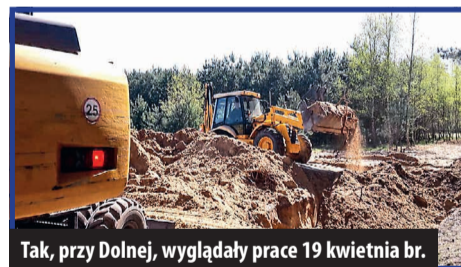
Tak, przy Dolnej, wyglądały prace 19 kwietnia br.