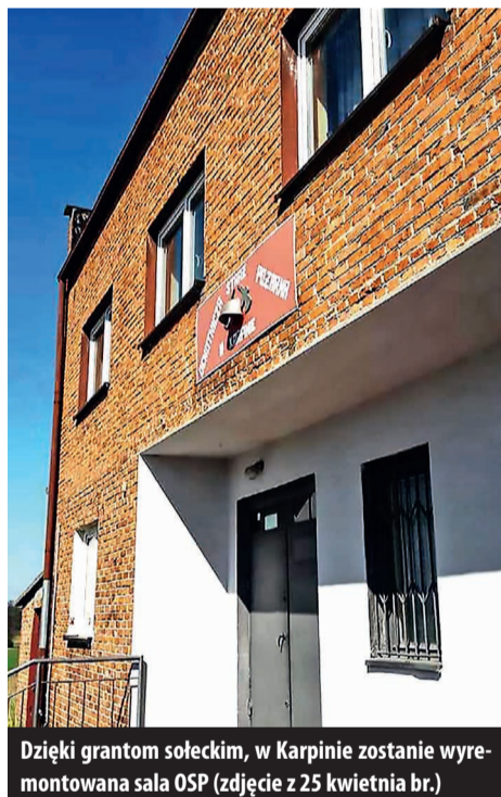
Dzięki grantom sołeckim, w Karpinie zostanie wyremontowana sala OSP (zdjęcie z 25 kwietnia br.)

Przypomnijmy, że w ubiegłym roku także trzy projekty z naszej gminy otrzymały granty, po 5 tys. zł. W Brójcach powstała altana (przy placu zabaw, za budynkiem Urzędu Gminy). W Bukowcu postawiono ławeczki, zrobiono chodnik i źródło uliczny przy świetlicy. W Kurowicach wyremontowano altanę.