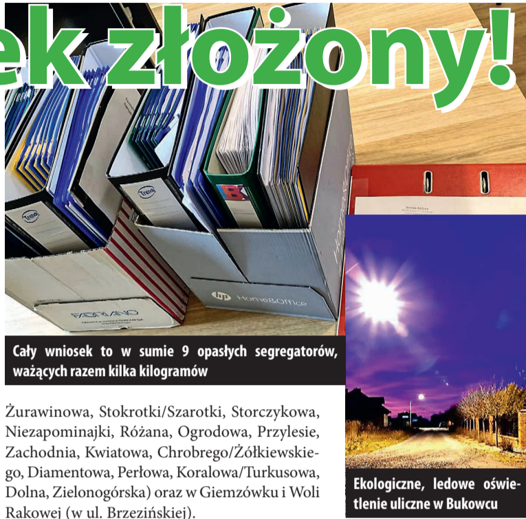
Cały wniosek to w sumie 9 opasłych segregatorów, ważących razem kilka kilogramów

Uzupełniające, ekologiczne oświetlenie przewidziane jest w Bukowcu (ulice Jesionowa,