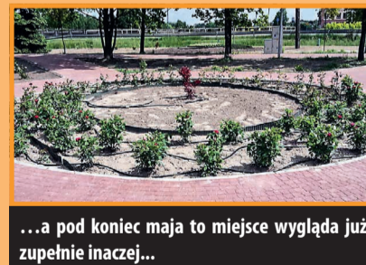
...a pod koniec maja to miejsce wygląda już zupełnie inaczej...

– Jaki jest udział „STER-u” w tym przedsięwzięciu?