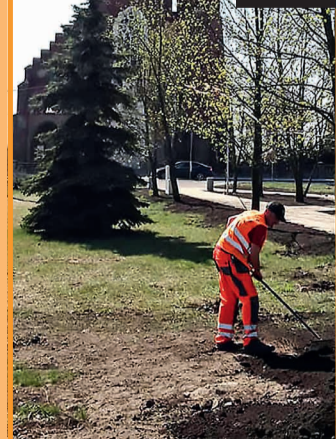
Jeszcze 18 kwietnia br. na skwerze pracował ciężki sprzęt...