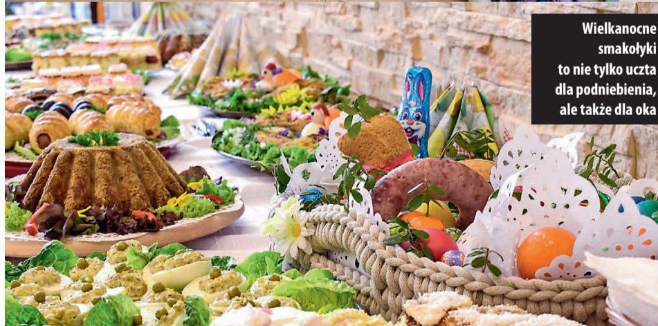
Wielkanocne smakołyki to nie tylko uczta dla podniebienia, ale także dla oka