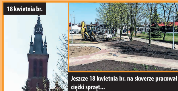
18 kwietnia br.