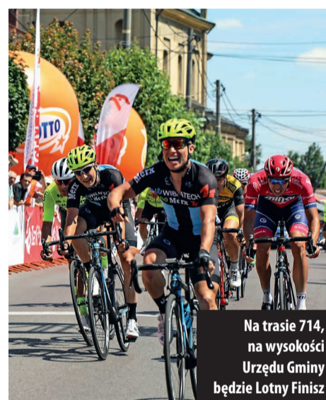
Na trasie 714, na wysokości Urzędu Gminy będzie Lotny Finisz