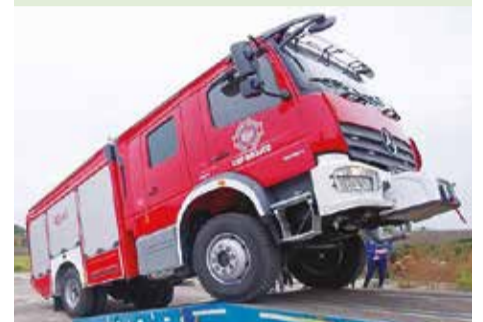
Nowy wóz strażacki dla druhów w Brójcach zastąpił wysłużonego Jelcza.