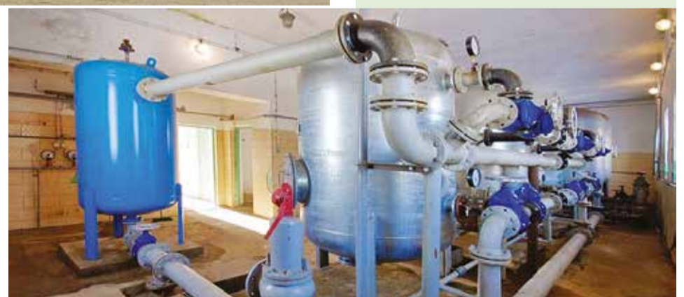
W ujęciu wody i stacji wodociągowej w Kurowicach. Wymieniono wszystkie urządzenia stanowiące cały ciąg technologiczny.