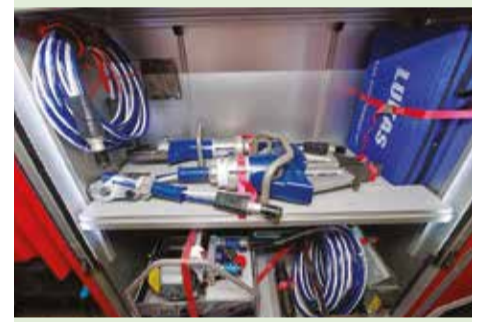
Gmina przeznaczyła kilkadziesiąt tysięcy złotych na wyposażenie jednostek Ochotniczych Straży Pożarnej. Każda jednostka na koniec ubiegłego roku została wyposażona w komplet nowych węży strażackich oraz inny sprzęt i odzież. Na zdjęciu szczęki życia zakupione dla OSP Bukowic.