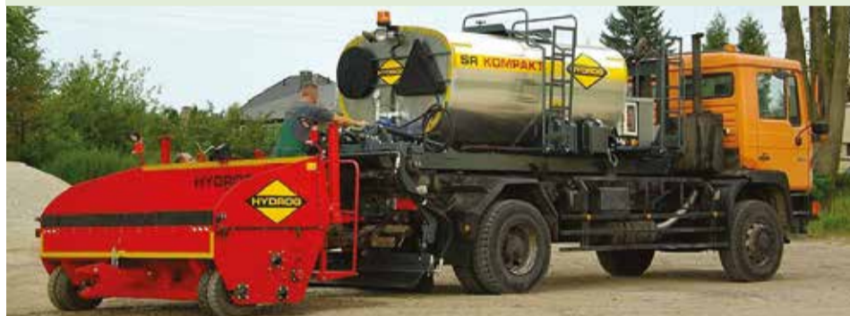
Maszyna do remontu dróg