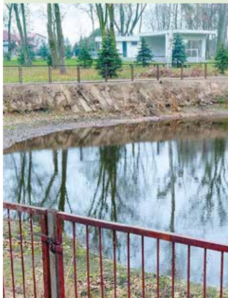
Ogrodzenie zbiornika przeciwpożarowego w Woli Rakowej było ważne z uwagi na bliskie sąsiedztwo przedszkola i szkoły podstawowej. Budowa ogrodzenia kosztowała 21 tys. zł.