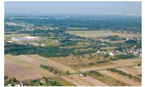
Na mocy porozumienia z Łódzką Specjalną Strefą Ekonomiczną został przygotowany projekt uzbrojenia terenów inwestycyjnych zlokalizowanych w Bukowcu.