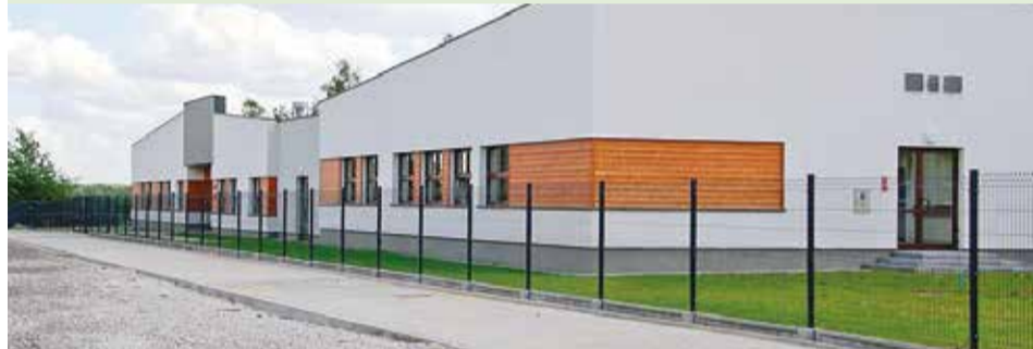
Chodnik przy Zespole Szkolno-Przedszkolnym w Bukowcu - koszt ponad 26 tys. zł. W najbliższym czasie przy przedszkolu pojawią się latarnie, a droga zostanie utwardzona masą asfaltową.