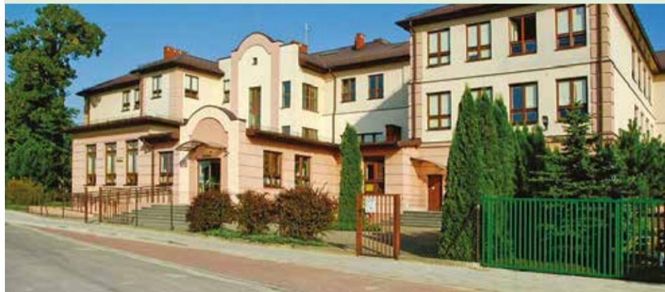
Chodnik i zatoka przystankowa na ulicy Szkolnej przy Zespole Szkół w Kurowicach kosztowała 75 tys. zł. Dzieci, młodzież i rodzice mogą chodzić w bezpiecznych warunkach.