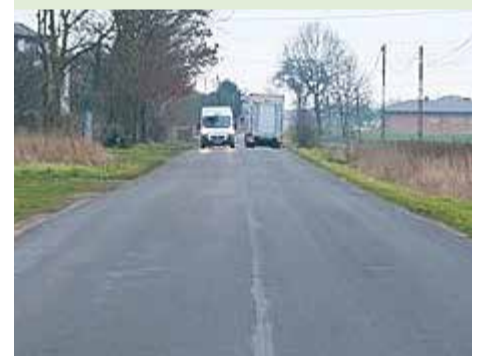
Wspólnie ze Starostwem Powiatu Łódzkiego Wschodniego gmina sfinansowała przebudowę drogi powiatowej nr 2926E w Pałczewie i w Woli Rakowej. Całkowity koszt zrealizowanej inwestycji wyniósł 521 382,00 zł i pochodził on w równych częściach z budżetów Powiatu Łódzkiego Wschodniego i Gminy Brójce.