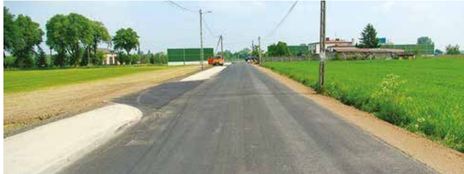
Droga w Przypuście dostosowana jest do podwyższonych obciążeń i wyposażona w chodnik. Do realizacji tej inwestycji gmina pozyskała środki finansowe w wysokości 100 tys. zł od przedsiębiorstwa posiadającego grunty w Przypuście. Całkowity koszt inwestycji wyniósł ponad 207 tys. zł.

Rozwojowi gminy mają służyć inwestycje, aby jednak przyciągnąć inwestorów trzeba stworzyć im dobre warunki. Na mocy porozumienia z Łódzką Specjalną Strefą Ekonomiczną został w ubiegłym roku przygotowany projekt uzbrojenia terenów inwestycyjnych zlokalizowanych w tej miejscowości. Dotyczy on budowy sieci wodociągowej, sieci energetycznej, budowy dróg wraz z niezbędnym oświetleniem oraz kanalizacją deszczową i sanitarną. Koszt sporządzonej dokumentacji projektowej wyniósł około 340 tys. zł, z czego aż 300 tys. zł pozyskaliśmy od ŁSSE! Po uzyskaniu wszystkich pozwoleń na budowę inwestycja będzie mogła się rozpocząć, aktualnie gmina ma już ich znaczną część.