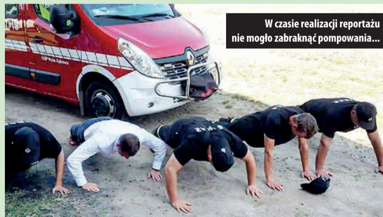
W czasie realizacji reportażu nie mogło zabraknąć pompowania...