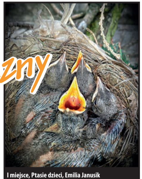
I miejsce, Ptasie dzieci, Emilia Janusik

Wszystkie prace można zobaczyć na stronie www.gok.brojce.pl w zakładce Fotogaleria GOK.