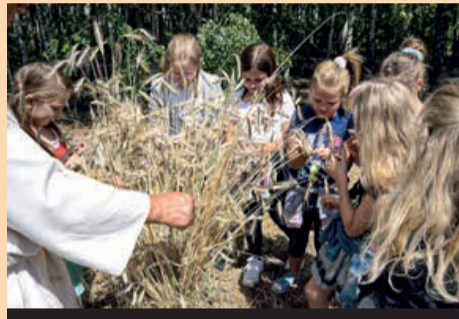
Od ziarenka do bochenka w Zagrodzie Edukacyjnej w Konarzewie

Zaczął się 9 lipca, czyli tuż przed umowną datą rozpoczęcia żniw, od wizyty w Zagrodzie Edukacyjnej w Konarzewie. A skoro żniwa za pasem to na dzieci czekały warsztaty pod tytułem „Od ziarenka do bochenka”. W ramach tych zajęć było wszystko to co związane jest ze żniwami, zbiorem zbóż i ich przetwarzaniem. Młocka cepami, pomoc w tradycyjnych sposobach zbioru zboża, a później? Jak zrobić