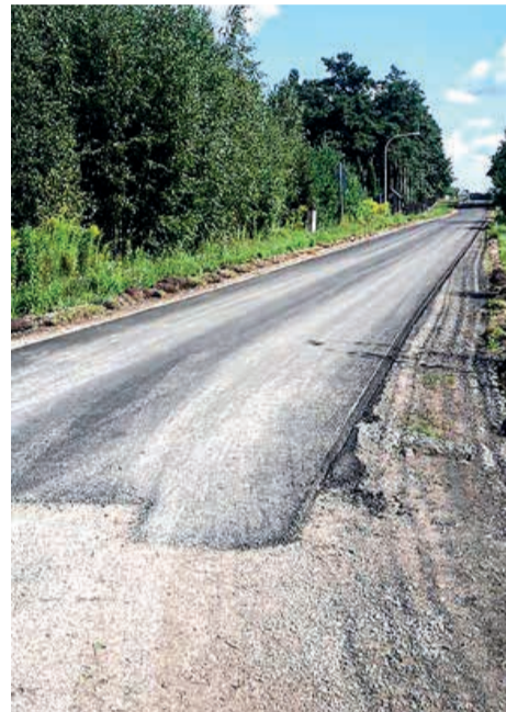
24 sierpnia br. ul. Kwiatowa tuż po pokryciu jej nową nawierzchnią asfaltową