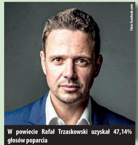
W powiecie Rafał Trzaskowski uzyskał 47,14% głosów poparcia

12 lipca br. w II turze wyborów prezydenckich, w naszej gminie Andrzej Duda uzyskał poparcie w wysokości 59,61% głosów, a Rafał Trzaskowski 40,39%. W całym kraju kandydaci uzyskali odpowiednio 51,03% i 48,97% głosów wyborców.