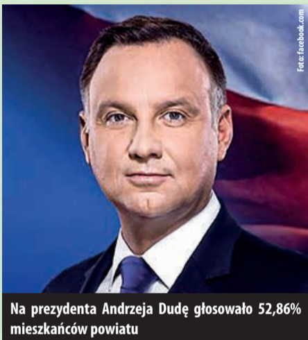
Na prezydenta Andrzeja Dudę głosowało 52,86% mieszkańców powiatu

W II turze spotkali się Andrzej Duda i Rafał Trzaskowski. 12 lipca br. frekwencja w naszej gminie była jeszcze wyższa. Wyniosła prawie 75%. Wygrał, tak jak w całym kraju, Andrzej Duda.