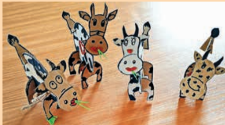
Papierowe krówki – efekt warsztatów twórczych w Świetlicy w Bukowcu

Warsztaty, gry, zabawy, wyjazdy, wycieczki... te wakacje dla dzieci z gminy Brójce na pewno nie były nudne. Tradycyjnie zatroszczyli się o to pracownicy Gminnego Ośrodka Kultury.