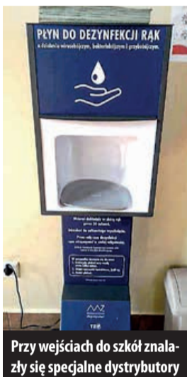
Przy wejściach do szkół znalazły się specjalne dystrybutory

Dystrybutory płynu dezynfekującego, imienne rejestry wejść i wyjść, monitoring dezynfekcji pomieszczeń, oddzielne strefy przebywania na przerwach dla każdej klasy, ofoliowane klawiatury komputerów, płyny do dezynfekcji w klasach, korkowe tablice bez ozdób, podłogi bez wykładzin i dywanów, itd.