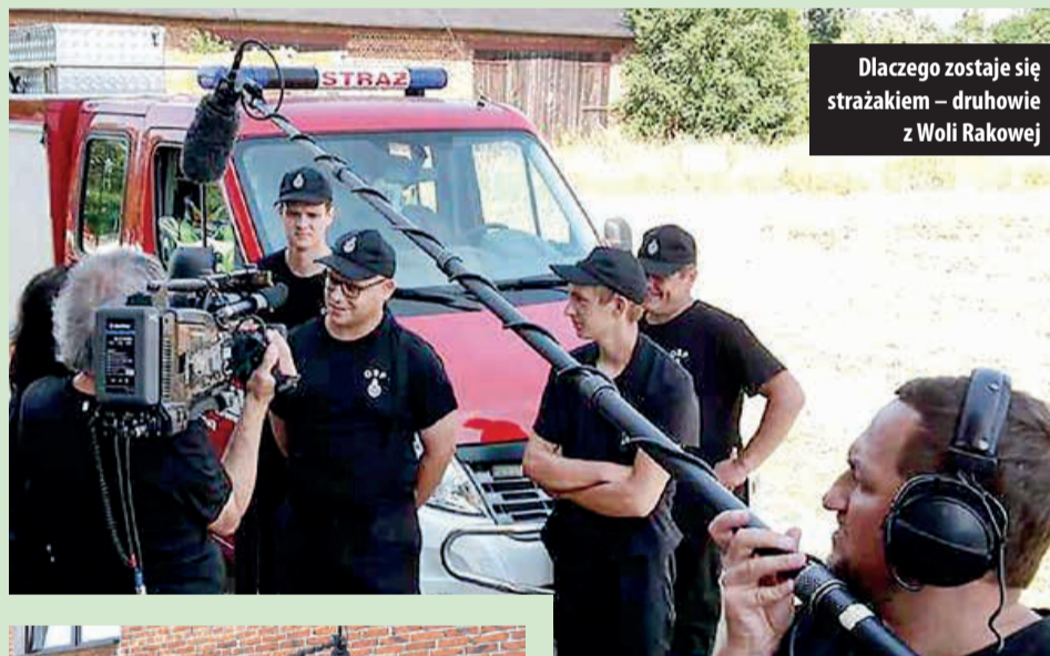
Dlaczego zostaje się strażakiem – druhowie z Woli Rakowej