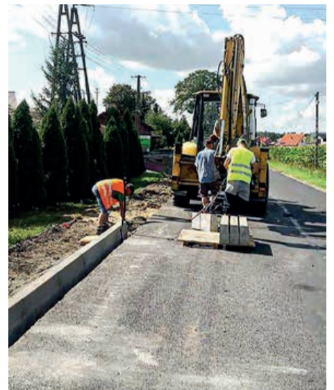
Chodnik w Woli Rakowej to wspólna inwestycja powiatu łódzkiego wschodniego i gminy Brójce