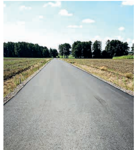
Droga w Kurowicach Folwarku jeszcze przed pokryciem wierzchnią warstwą ścieralną