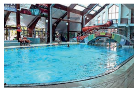
Perła to nowoczesny park wodny o powierzchni 1 500 m 2