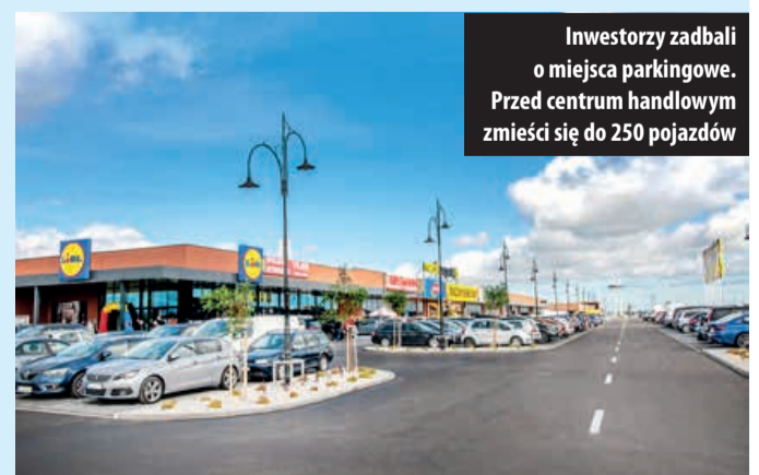
Inwestorzy zadbali o miejsca parkingowe. Przed centrum handlowym zmieści się do 250 pojazdów