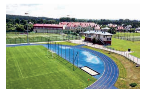
Z takiego kompleksu boisk sportowych można być dumnym