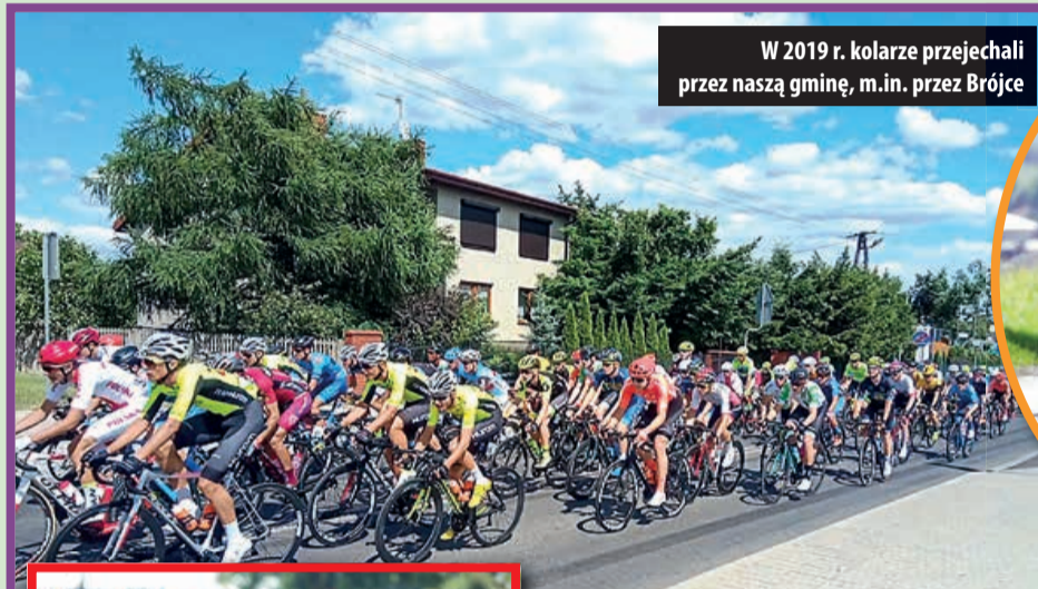
W 2019 r. kolarze przejechali przez naszą gminę, m.in. przez Brójce

Tego samego dnia w godz. 11:40–14:20 na ul. Piotrkowskiej (w tym samym miejscu), odbyła się jedna z imprez towarzyszących czyli Mini Wyścig „Solidarności” dla dzieci.