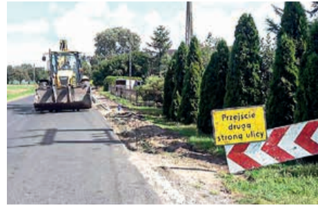
Wola Rakowa, chodnik powstał wzdłuż ul. Tuszyńskiej

Także w sierpniu br. układano prawie kilometr chodnika wzdłuż ulicy Tuszyńskiej w Woli Rakowej czyli drogi powiatowej nr 2912E. Ta inwestycja była współfinansowana przez powiat łódzki wschodni i naszą gminę.