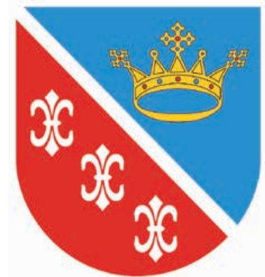
Herb gminy Sitkówka-Nowiny, wkrótce gminy Nowiny

Gmina Sitkówka-Nowiny leży w bezpośrednim sąsiedztwie stolicy województwa świętokrzyskiego, Kielc. Ma charakter przemysłowy i liczy około 7.800 mieszkańców. To druga oficjalna gmina partnerska Brójce. Od kilku lat współpracujemy także z miejsko-wiejską gminą Trzciel z województwa lubuskiego.