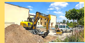
26 czerwca br.

Zgodnie z planem cała inwestycja (termomodernizacja budynku i urządzenie terenu wokół niego), zakończy się pod koniec tego roku. Łączny koszt realizacji projektu to blisko 4 mln zł, z czego 2,25 mln zł gmina pozyskała z rządowego programu Polski Ład.