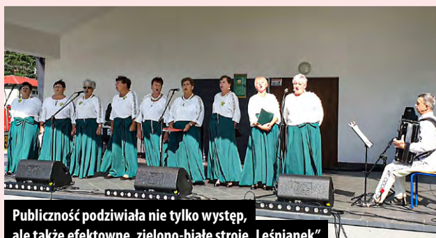
Publiczność podziwiała nie tylko występ, ale także efektowne, zielono-białe stroje „Leśnianek”

Tymczasem na terenie pikniku przybywało gości.