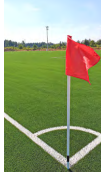
14 sierpnia br.