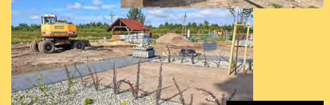
4 września br.