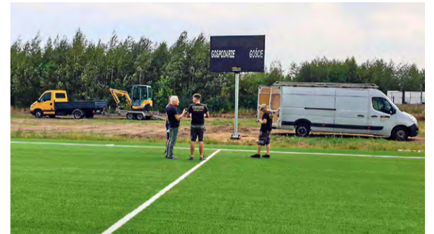
18 sierpnia br. montaż elektronicznej tablicy wyników

Obiekt przy ul. Szkolnej w Bukowcu wymaga jeszcze ostatnich szlifów, by móc przyjąć na swoją murawę pierwszych zawodników. Będzie to możliwe w październiku br. Całkowity koszt, I etapu inwestycji, to 4,2 mln zł. Gmina uzyskała na ten cel