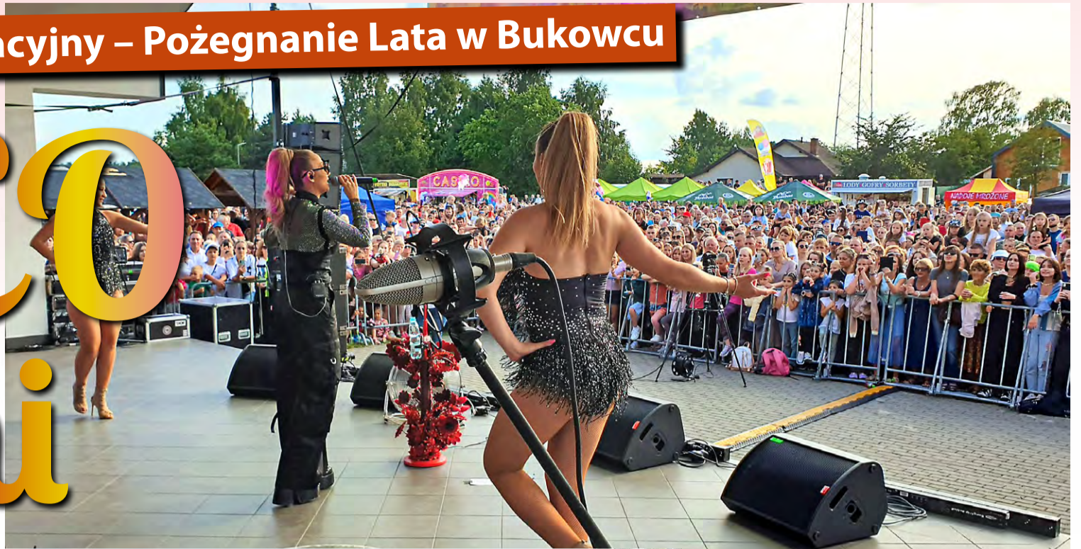
Ostatnia niedziela wakacji na koncercie CLEO? Okazało się, że zwłaszcza dla najmłodszych fanów artystki, to była nie lada gratka

Setki ludzi odwiedziły 3 września br. Bukowiec. W niedzielne popołudnie odbył się tradycyjny, gminny festyn. Przyjechali goście z bliska i z daleka. Byli przedstawiciele władz. Na scenie wystąpiły lokalne zespoły i gwiazdy – przede wszystkim CLEO. Swoje możliwości prezentowali strongmani. Były atrakcje i przysmaki, a pogoda...? Lepszej nie można było sobie wymarzyć!