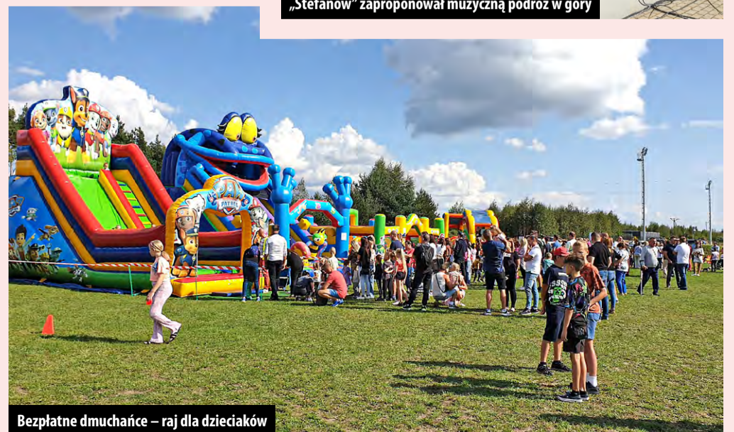
Bezpłatne dmuchańce – raj dla dzieciaków