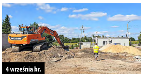
4 września br.

1,35 mln zł na zaprojektowanie i wybudowanie tej inwestycji, gmina pozyskała na początku października 2022 r. z Urzędu Marszałkowskiego w Łodzi. Całość prac ma kosztować w sumie 2,85 mln zł.