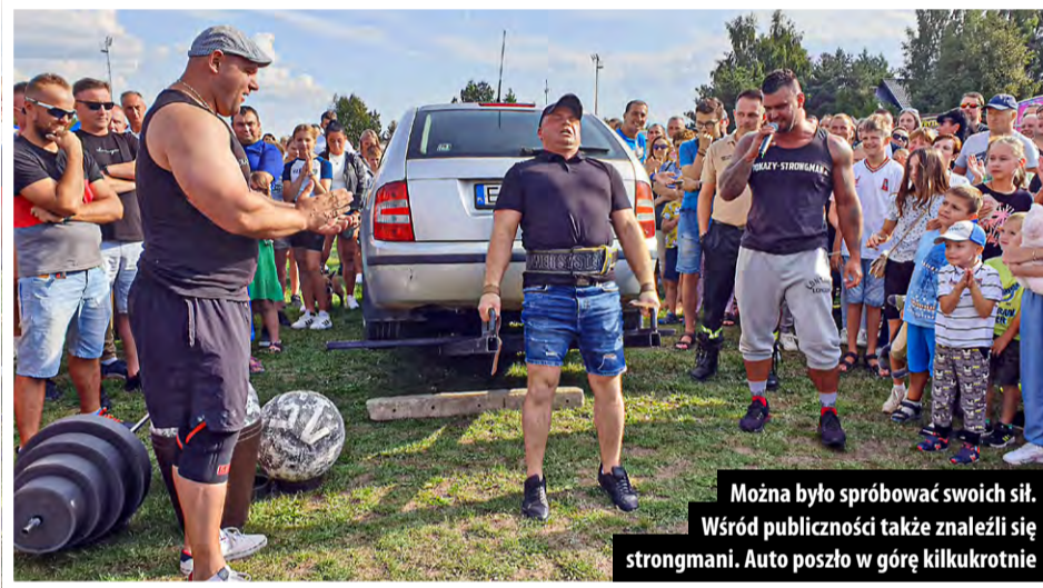
Można było spróbować swoich sił. Wśród publiczności także znaleźli się strongmani. Auto poszło w górę kilkakrotnie