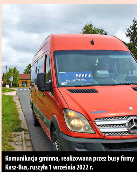
Komunikacja gminna, realizowana przez busey firmy Kasz-Bus, ruszyła 1 września 2022 r.

GAZETA INFORMACYJNA GMINY BRÓJCE WYDAWCA: Urząd Gminy Brójce, 95-006 Brójce 39, woj. łódzkie, www.facebook.com/portal.brojce, www.brojce.pl Pod redakcją Tomasza Boruszcza. Redakcja zastrzega sobie prawo skrótu materiałów nadesłanych. Skład, łamanie: Agencja Wydawnicza PAJ-Press. Druk: JW Projekt.