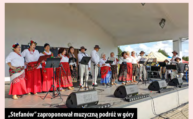
„Stefanów” zaproponował muzyczną podróż w góry

Taka impreza nie mogłaby się odbyć bez wsparcia partnerów i sponsorów, którymi w tym roku były firmy: INTAP z Bukowca, 2K Drukarnia Opakowań z Łodzi, MARVEL z Łodzi, KUBA z Bukowca i PTAK ze Rzgowa.