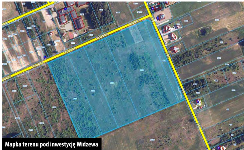
Mapka terenu pod inwestycję Widzewa

A Młody Widzew? Oczywiście, że tak! 25 sierpnia br. odbyło się spotkanie z dyrekcjami szkół w Bukowcu i Kurowicach