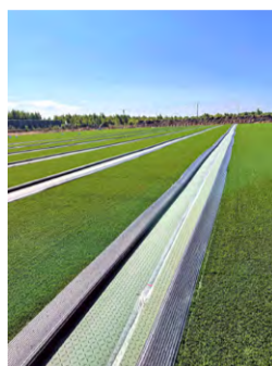
1 sierpnia br.