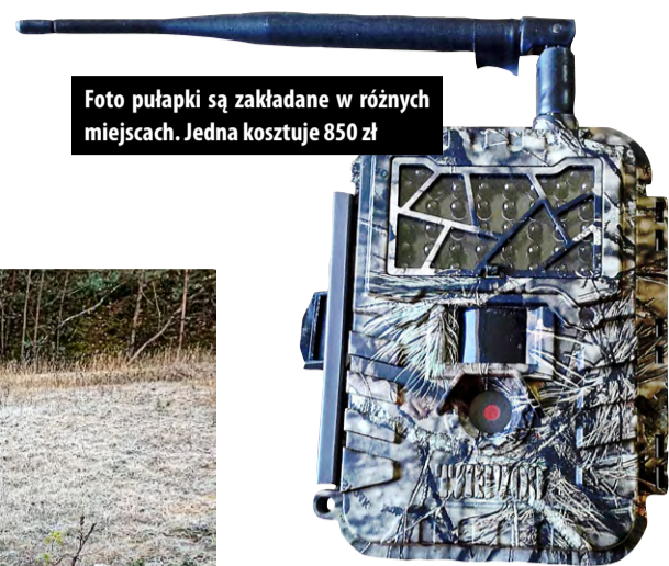
Foto pułapki są zakładane w różnych miejscach. Jedna kosztuje 850 zł