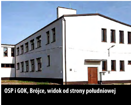
OSP i GOK, Brójce, widok od strony południowej