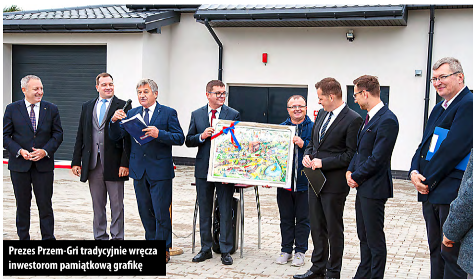
Prezes Przem-Gri tradycyjnie wręcza inwestorom pamiątkową grafikę

Takiej inwestycji w gminie Brójce wcześniej nie było. Takiego otwarcia też. Gminna Oczyszczalnia Ścieków w Kurowicach, warta 10 mln zł została oficjalnie uruchomiona 30 września br.