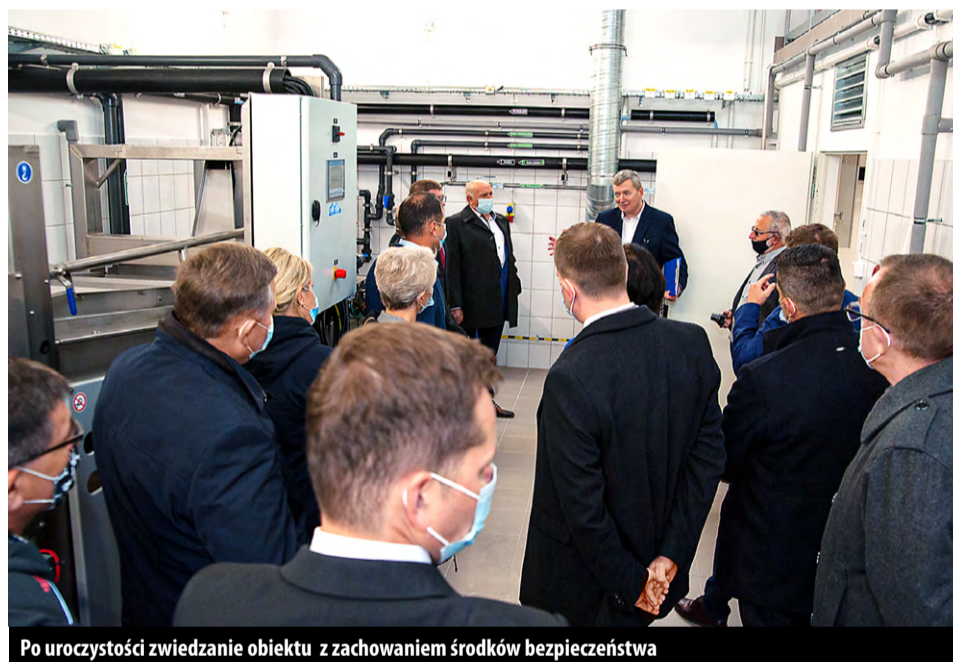
Po uroczystości zwiedzanie obiektu z zachowaniem środków bezpieczeństwa

Pierwszą łopatę na placu budowy Gminnej Oczyszczalni Ścieków przy ul. Dolnej, na granicy Bukowca i Kurowic, wkopano 11 marca 2019 r.