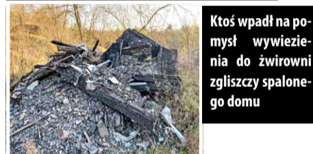
Ktoś wpadł na pomysł wywiezienia do żwirowni zgłiszczy spalonego domu