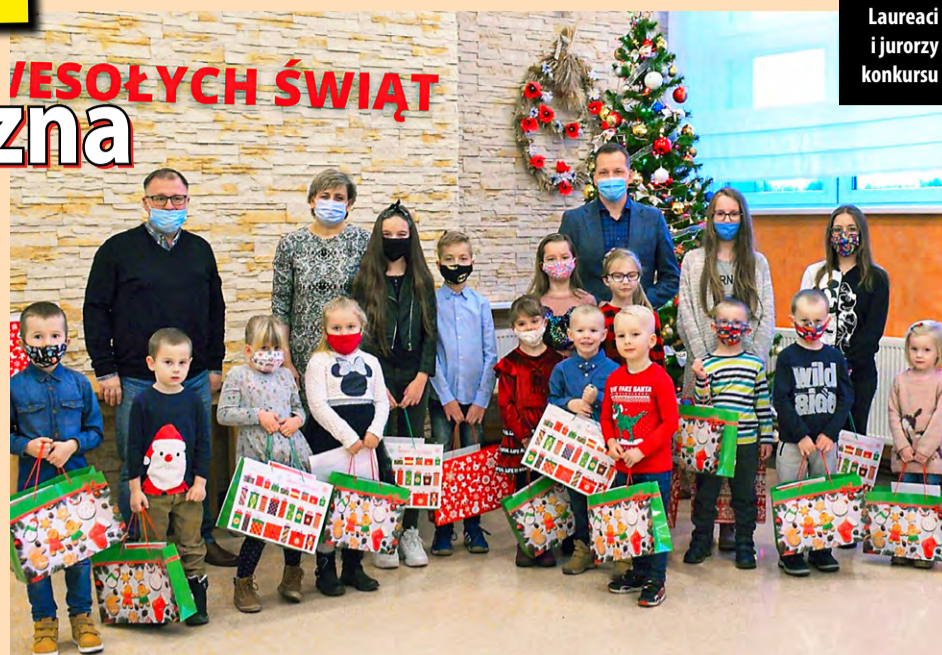
Laureaci i jurorzy konkursu