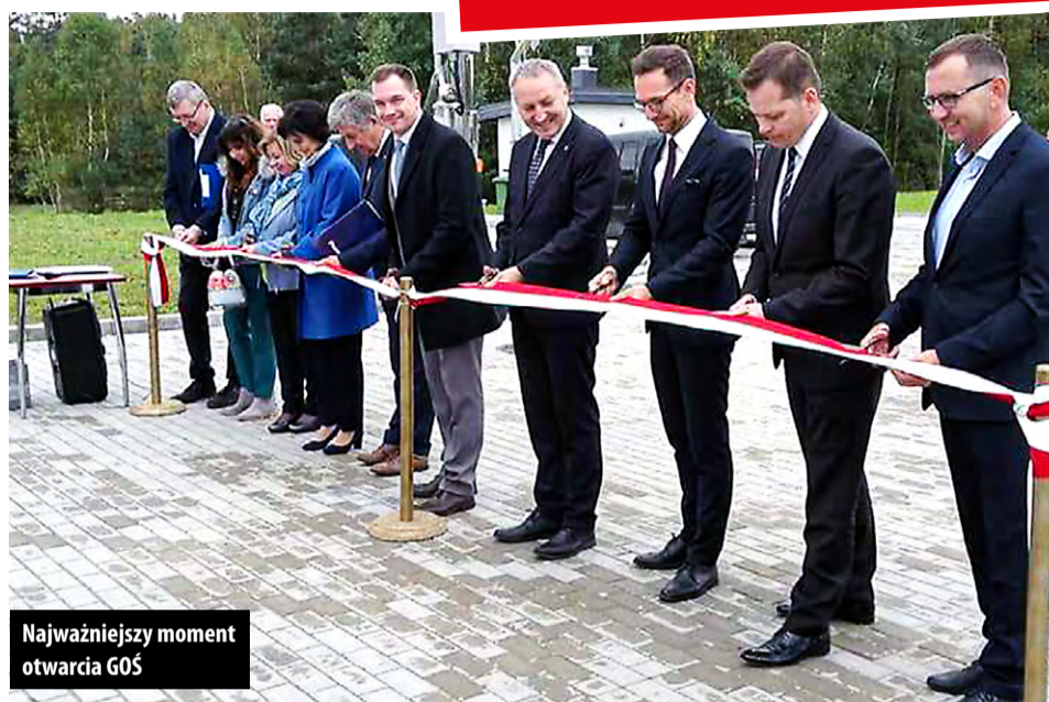
Najważniejszy moment otwarcia GOŚ