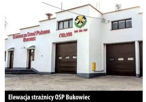
Elewacja strażnicy OSP Bukowiec