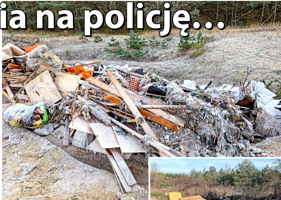
Ktoś wywoził cały rozebrany dom z podmurówką i boazerią...

Na naszym Portalu Informacyjnym Gminy Brójce na Facebooku zaprezentowano dokumentację poszczególnych przypadków zaśmiecania, z prośbą o wszelkie informacje mogące służyć ujawnieniu tożsamości „nielegalnych śmieciarzy”.