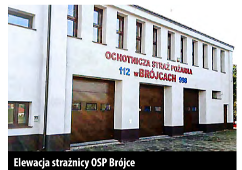
Elewacja strażnicy OSP Brójce

Zakończyły się termomodernizacje budynków strażnicy OSP i Gminnego Ośrodka Kultury w Brójcach i strażnicy OSP w Bukowcu. Po kompleksowym remoncie, w październiku i listopadzie br. dokonano odbiorów technicznych obu inwestycji.