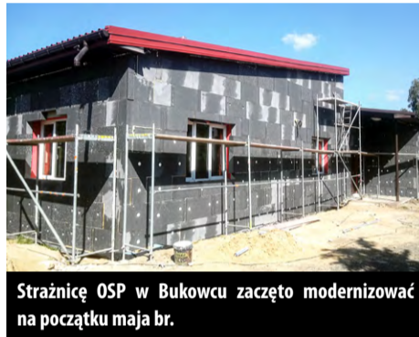
Strażnicę OSP w Bukowcu zaczęto modernizować na początku maja br.