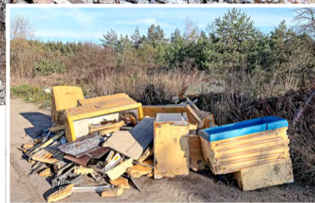
Pozbawione metalowych części pozostałości przemysłowych chłodziarek