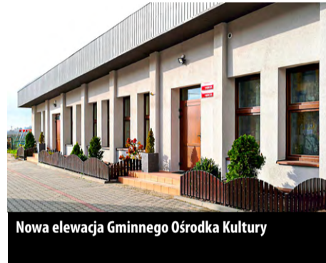
Nowa elewacja Gminnego Ośrodka Kultury