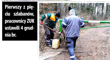
Pierwszy z pięciu szlabanów, pracownicy ZUK ustawili 4 grudnia br.