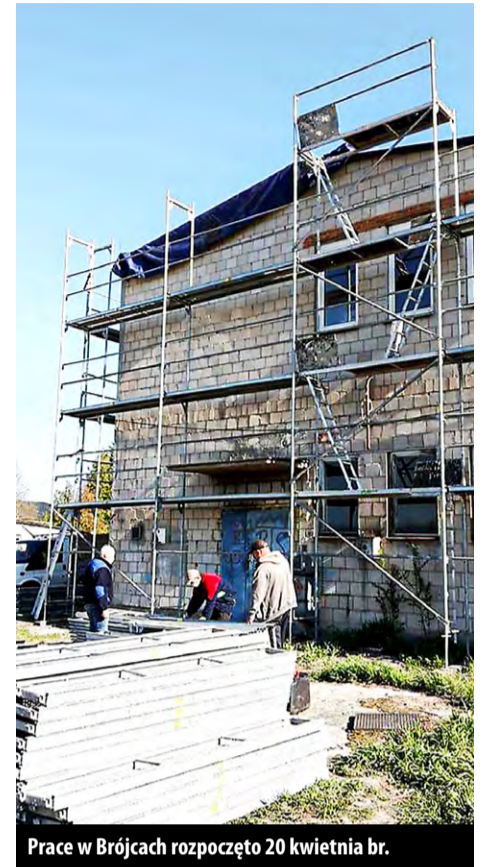
Prace w Brójcach rozpoczęto 20 kwietnia br.