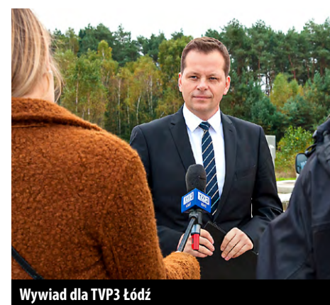
Wywiad dla TVP3 Łódź