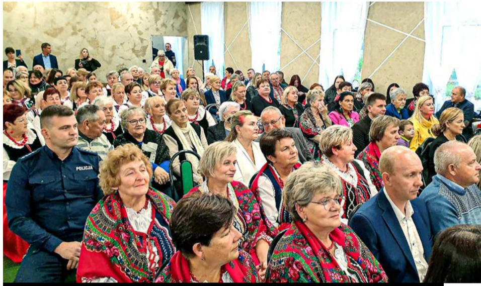
Publiczność dopisała. Na pierwszym planie członkinie zespołu KOWALANKI z partnerskiej gminy Nowiny

5 października br. To był wspaniały, wyjątkowy sobotni wieczór w Stefanowie! Redakcja Gazety Informacyjnej Gminy Brójce, Dnia Ziemniaka oraz uroczystości 40-lecia Amatorskiego Zespołu Śpiewaczego STEFA