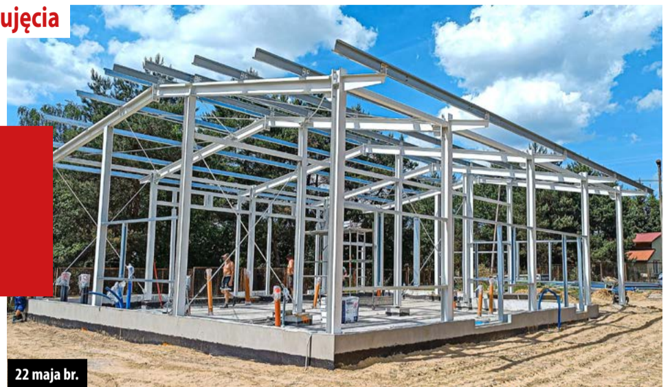
22 maja br.

Inwestycja kosztowała ok. 5 mln zł. Gmina pozyskała na nią dotację w wysokości 3,8 mln zł z Programu Inwestycji Strategicznych Polski Ład.