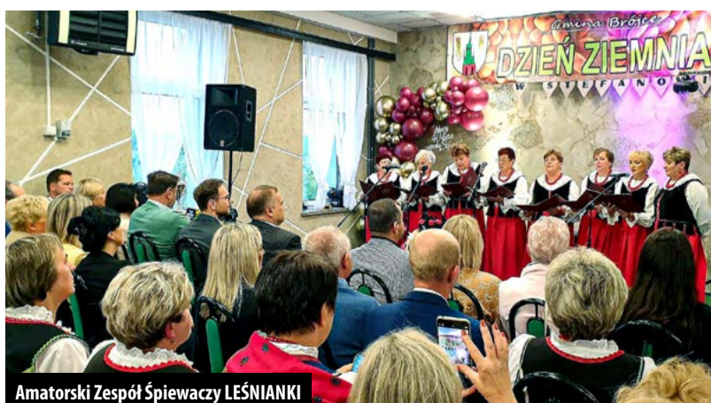
Amatorski Zespół Śpiewaczy LEŚNIANKI

To była wspaniała impreza, dzięki wszystkim organizatorom, Gminnemu Ośrodkowi Kultury w Brójcach, Kołu Gospodyń Wiejskich Nad Nerem w Stefanowie oraz druhom Ochotniczej Straży Pożarnej w Stefanowie.