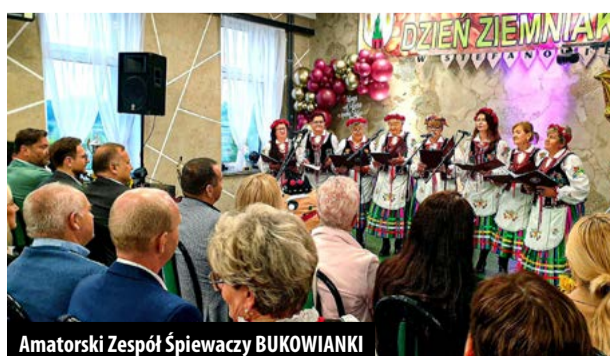
Amatorski Zespół Śpiewaczy BUKOWIANKI