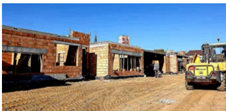
25 października br.

Ze żłobka i przedszkola, będzie mogła korzystać łącznie ponad setka dzieci. Całkowity koszt projektu szacowany jest na blisko 9,5 mln zł, z czego prawie 8 mln zł to dofinansowanie z Programu Inwestycji Strategicznych Rządowego Funduszu Polski Ład.