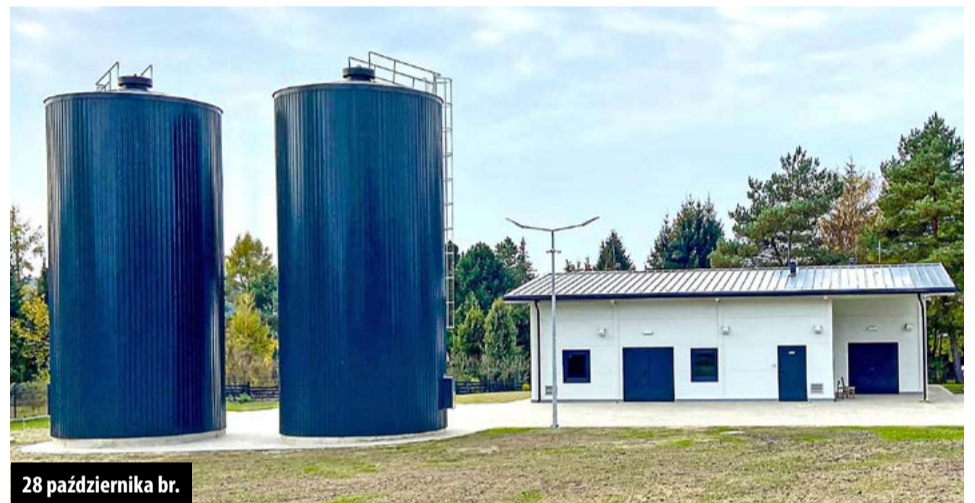
28 października br.

Trwa budowa żłobka i przedszkola w Kurowicach