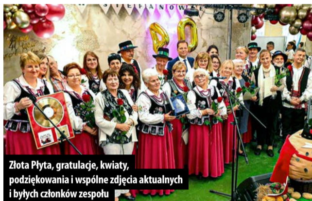
Złota Płyta, gratulacje, kwiaty, podziękowania i wspólne zdjęcia aktualnych i byłych członków zespołu