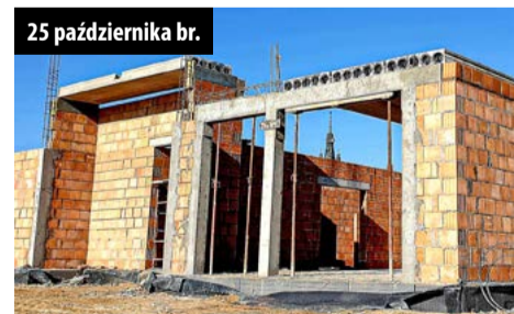
25 października br.

Nowy asfalt na ulicach dojazdowych do Gminnej Oczyszczalni Ścieków