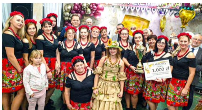
Zdjęcia z wykopków, bogaty występ sceniczny i wspaniały projekt mody w wykonaniu par z KGW Wola Rakowa, na wszystkich zrobili ogromne wrażenie