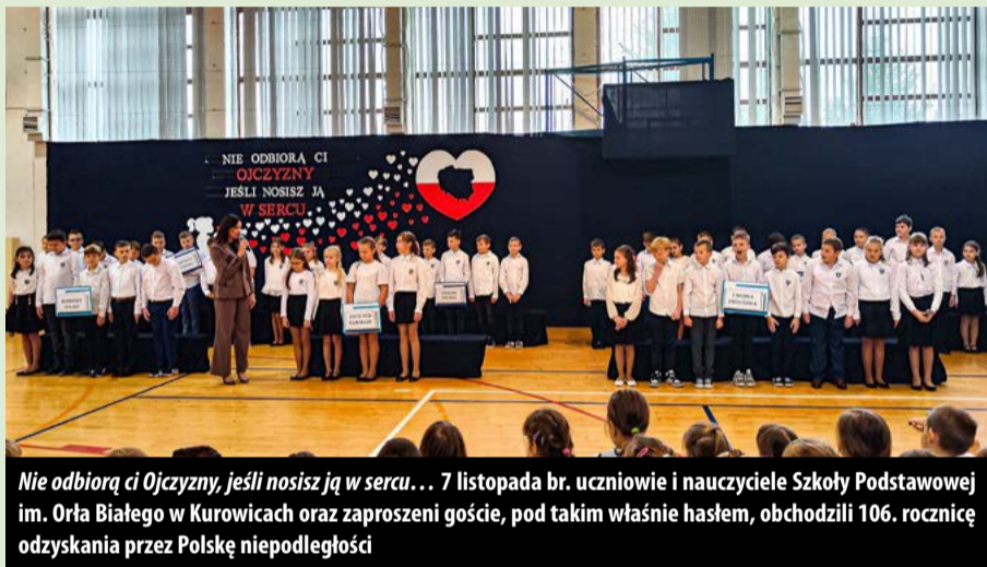
Nie odbiorą ci Ojczyzny, jeśli nosisz ją w sercu... 7 listopada br. uczniowie i nauczyciele Szkoły Podstawowej im. Orła Białego w Kurowicach oraz zaproszeni goście, pod takim właśnie hasłem, obchodzili 106. rocznicę odzyskania przez Polskę niepodległości

11 Listopada, Narodowe Święto Niepodległości w gminie Brójce. Po mszy świętej w kościele w Kurowicach, przedstawiciele władz gminy i powiatu łódzkiego wschodniego złożyli wiązanki kwiatów i zapalili znicze na Grobie Nieznanego Żołnierza i grobach ofiar hitlerowskiej okupacji.