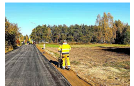
25 października br.

W sumie to 555 m nowej nawierzchni asfaltowej. Inwestycję realizuje od początku października br. firma LARKBUD z Łodzi. Całkowity koszt tego projektu to prawie 450 tys. zł. Gmina pozyskała na ten cel dofinansowanie z budżetu Województwa Łódzkiego, pochodzące z tytułu wyłączenia z produkcji gruntów rolnych.