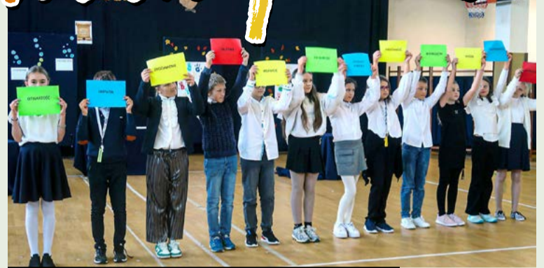
Według uczniów ze szkoły w Bukowcu, to właśnie takimi cechami powinien charakteryzować się współczesny nauczyciel