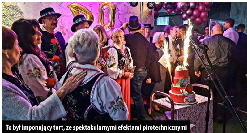
To był imponujący tort, ze spektakularnymi efektami pirotechnicznymi

► Cztery dekady Amatorskiego Zespołu Śpiewaczego STEFANÓW