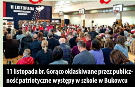
11 listopada br. Gorąco oklaskiwane przez publiczność patriotyczne występy w szkole w Bukowcu

A później wszyscy wzięli udział w kolejnym, tradycyjnym już, Marszu Niepodległości. Kolorowy, radosny, rodzinny, uśmiechnięty pochód ulicami Bukowca, w takt muzyki granej przez Orkiestrę Dęta OSP Kurowice.