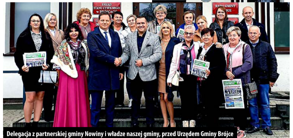
Delegacja z partnerskiej gminy Nowiny i władze naszej gminy, przed Urzędem Gminy Brójce

nasze najnowsze inwestycje: kompleks sportowy w Bukowcu, Stację Uzdatniania Wody w Kotlinach, plac budowy żłobka i przedszkola w Kurowicach. Zjedli obiad w siedzibie KGW Brójce i udali się do Stefanowa, aby wziąć udział w Dniu Ziemniaka. Kowalanki w swoich strojach, życzenia dla świętującego 40-lecia zespołu Stefanów i udział w jury konkursu KGW o Puchar Wójta Gminy Brójce.