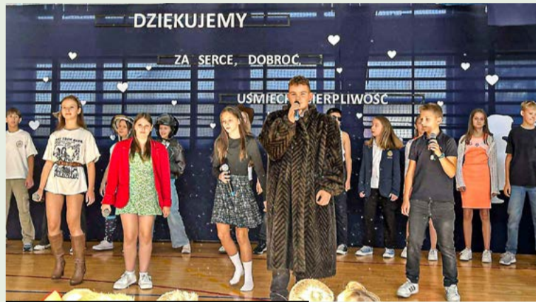
Uroczystość w Szkole Podstawowej w Kurowicach