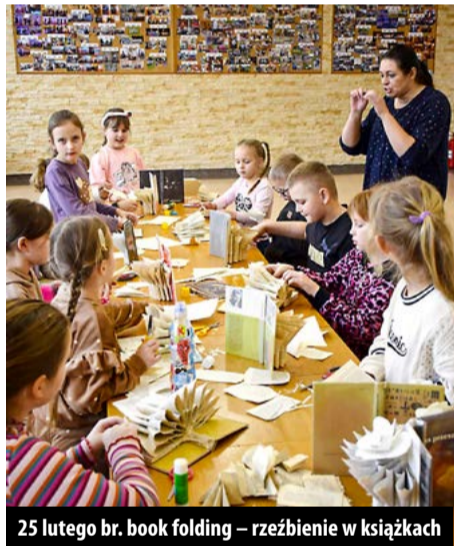
25 lutego br. book folding – rzeźbienie w książkach

Szczegółowe relacje z tych wydarzeń na stronie GOK: https://gok.brojce.pl/