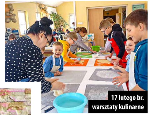
17 lutego br. warsztaty kulinarne

21 lutego dzieciaki super się bawiły na... Super Zabawie. Łatwiej chyba wymienić czego tam nie było. Gry, zgadywanki, tańce... to co dzieciaki uwielbiają!