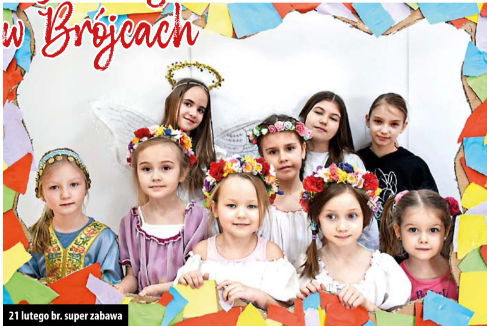
21 lutego br. super zabawa

Zimowa przerwa w nauce wystartowała 17 lutego i tego dnia, przyszli szefowie kuchni, szlifowali swoje cukiernicze umiejętności w Świetlicy w Bukowcu. Tego dnia na warsztat poszły słodkości – faworki i pączki jogurtowe. Było mniam!